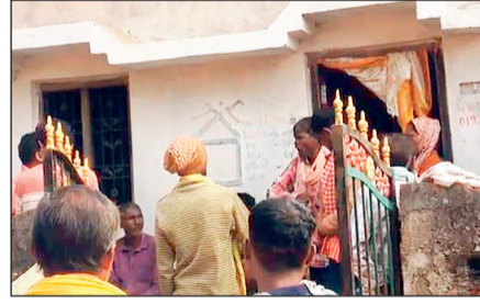
बहस के बाद बिगड़े हालात स्थिति उस समय और बिगड़ गई जब दोनों पक्षों के बीच तीखी बहस शुरू हो गई। हालांकि किसी प्रकार की अप्रिय घटना की सूचना नहीं है, लेकिन माहौल काफी देर तक तनावपूर्ण बना रहा। आक्रोशित ग्रामीणों ने साफ शब्दों में चेतावनी दी कि उनके क्षेत्र में किसी भी प्रकार के बाहरी धर्म प्रचार को बर्बर नहीं किया जाएगा।

हरिभूमि न्यूज ►► कांकेर दुधावा क्षेत्र के ग्राम देवडोंगर में रविवार को उस समय तनावपूर्ण स्थिति बन गई, जब एक घर में आयोजित प्रार्थना सभा को लेकर ग्रामीणों ने कड़ा विरोध दर्ज कराया। देखते ही देखते मामला इतना बढ़ गया कि गांव में हंगामा के हालात बन गए। ग्रामीणों ने प्रार्थना की आड़ में धर्मांतरण के प्रयास का आरोप लगाते हुए अपनी पारंपरिक आस्था और संस्कृति पर खतरा बताया। जानकारी के अनुसार रविवार 4 जनवरी को ग्राम देवडोंगर