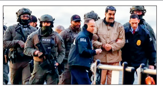
वेनेजुएला के राष्ट्रपति निकोलस मादुरो और उनकी पत्नी सिलिया प्रतोरस को न्यूयॉर्क में मैनहटन की कोर्ट में लाया गया।

स्विटजरलैंड ने फ्रीज की मादुरो की संपत्तियां स्विटजरलैंड सरकार की फेडरल काउंसिल ने 5 जनवरी 2026 को बड़ा और अहम फैसला किया है। इस फैसले के तहत वेनेजुएला के राष्ट्रपति निकोलस मादुरो और उनसे जुड़े अन्य लोगों की स्विटजरलैंड में मौजूद सभी संपत्तियों को तुरंत फ्रीज कर दिया गया है। इसका मतलब है कि अब इन संपत्तियों को न तो बेचा जा सकता है और न ही देश से बाहर भेजा जा सकता है। फेडरल काउंसिल ने साफ तौर पर कहा है कि यह कार्रवाई वेनेजुएला की मौजूदा सरकार के किसी भी सदस्य पर लागू नहीं होगी।